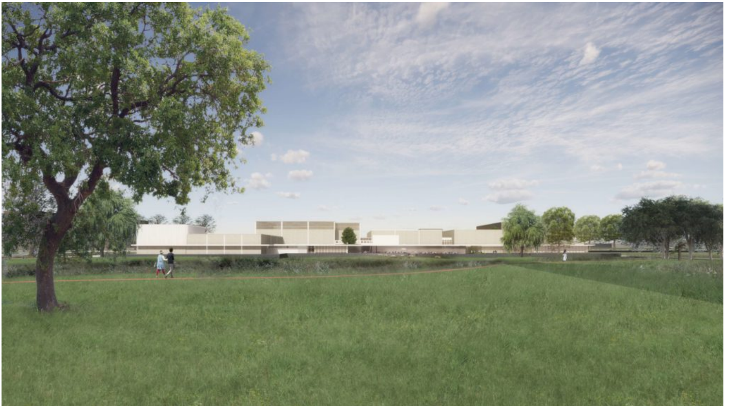
Beeld door DP6 architectuurstudio

Het Studentensportcentrum is sinds de jaren '60 sterk gegroeid. In de afgelopen decennia is het sportgebouw in vier stappen verder uitgebreid, maar mist een evenwichtige ruimtelijke samenhang. Het is een doolhof van donkere gangen, zoals de universiteit het omschreef, en ontbeert een passende entree. Het weerspiegelt niet het uitnodigende karakter van een druk bezocht sportcentrum waar op hoog niveau wordt gepresteerd.