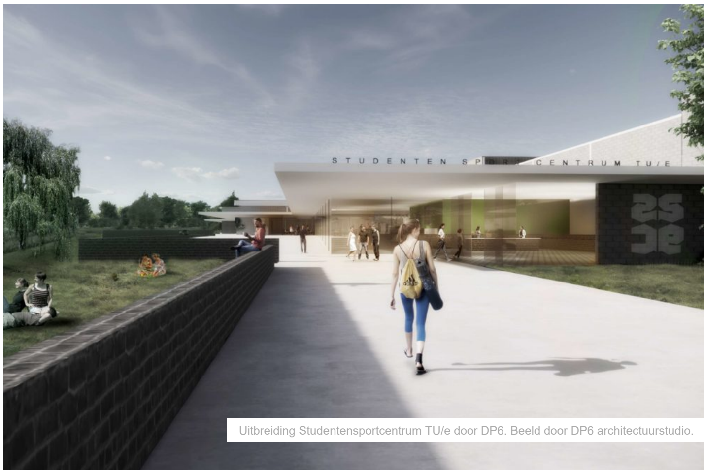
Uitbreiding Studentensportcentrum TU/e door DP6.