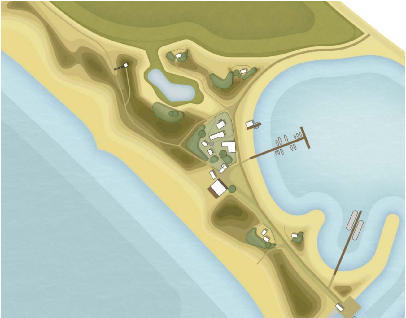
Stedenbouwkundig plan Marker Wadden door Palmhout

In het stedenbouwkundig plan door Palmhout zijn deze opstallen met veel ruimtelijk gevoel ondergebracht in een nieuwe kleine nederzetting. De gebouwen zijn zo gegroepeerd dat ze opgaan in het omliggende esoterische landschap, maar tegelijkertijd de bezoekers van de vaste wal verwelkomen.