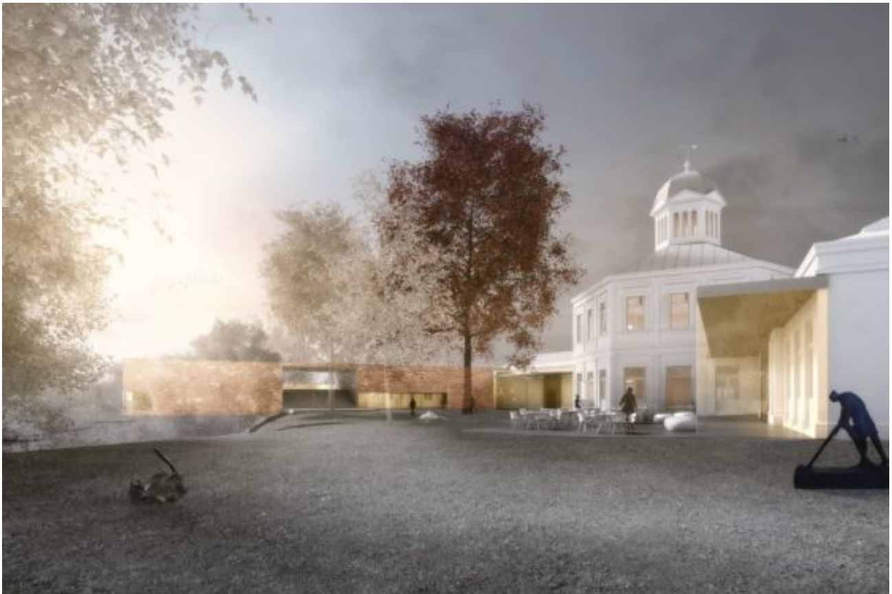
Het ontwerp van Benthem Crouwel Architects

Onlangs won Benthem Crouwel Architects de architectenselectie voor de uitbreiding en renovatie van Museum Arnhem. Er is vraag naar extra expositieruimte, een nieuwe entree, museumcafé en publieksfaciliteiten. De unieke locatie op de stuwwal en de bestaande monumentale Buitensociëteit uit 1875, maakten de opgave uitdagend en kansrijk. Vijf uiteenlopende teams werden geselecteerd voor een tweede ronde. Dit leverde interessante ontwerpen op. Deze week lichten we er elke dag een uit.