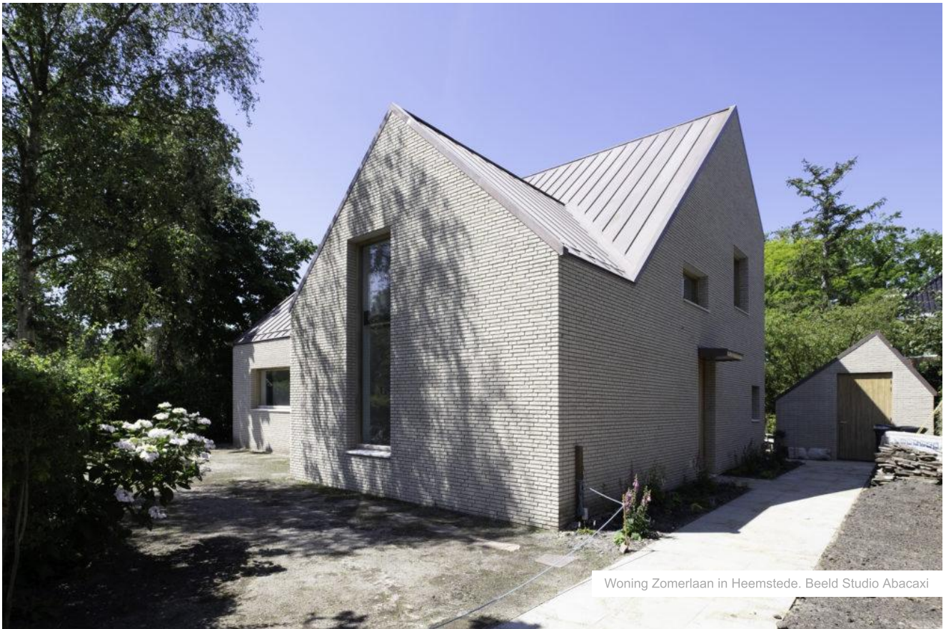
Woning Zomerlaan in Heemstede.